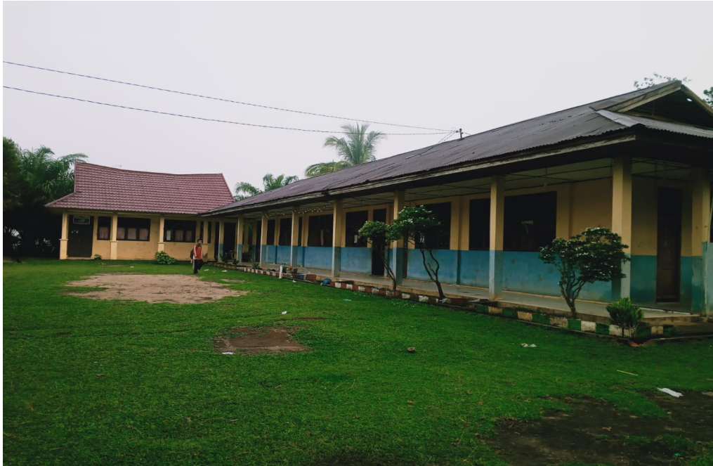
Gambar 1 : Lokasi Penelitian SMP Satu Atap Pulau Kopung