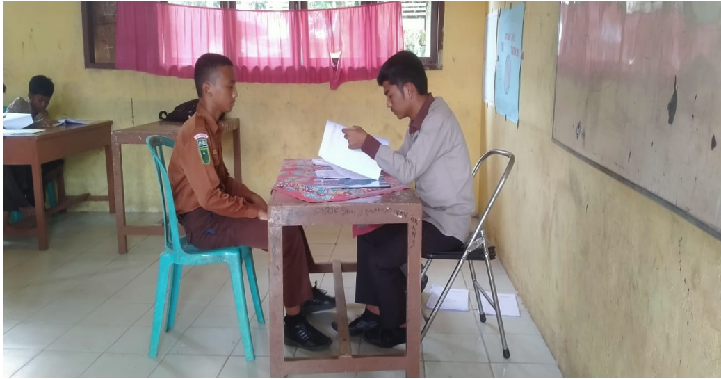
Gambar 3 : Peneliti sedang mewawancarai siswa yang menjadi responden penelitian