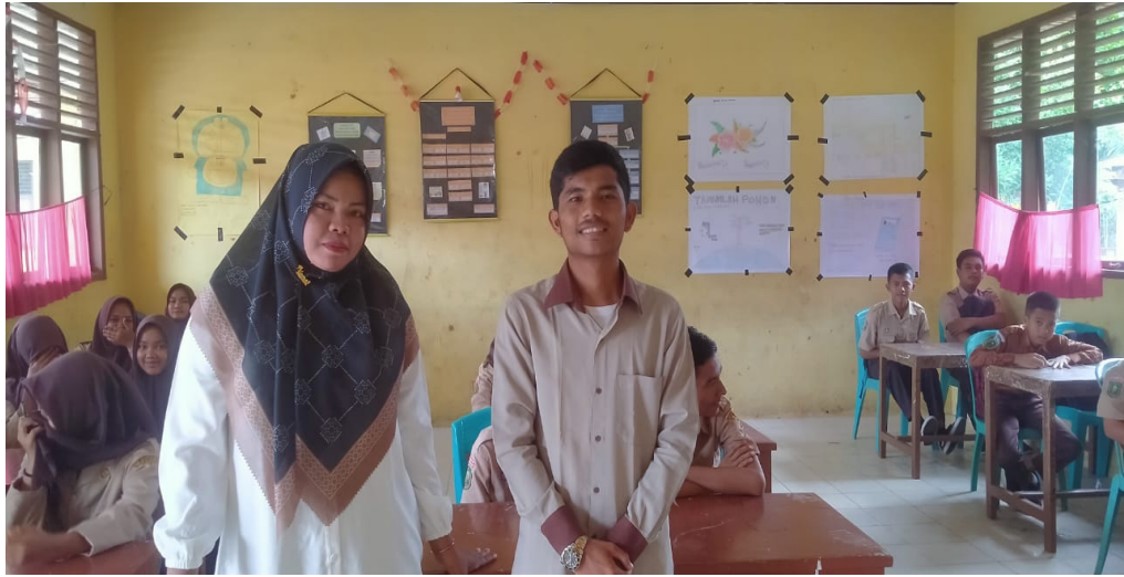
Gambar 2 : Peneliti bersama guru mata pelajaran Pendidikan Agama Islam kelas VIII di SMP Satu Atap Pulau Kopung Kecamatan Sentajo Raya