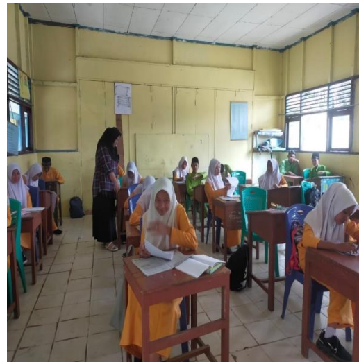
Pembagian Angket di Kelas VII.3