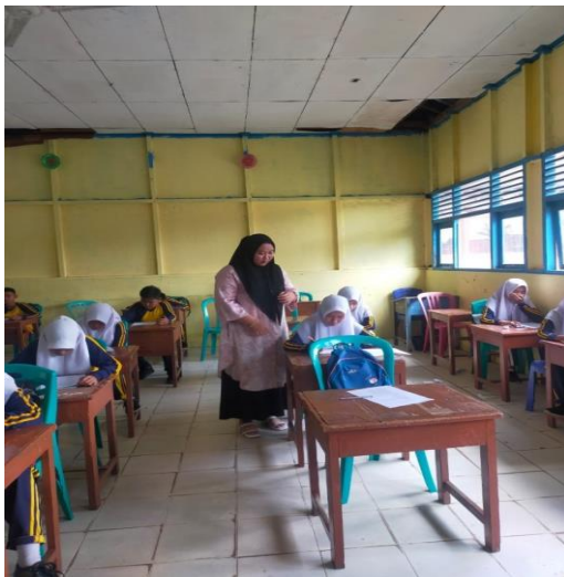
Pembagian Angket di Kelas VIII.2