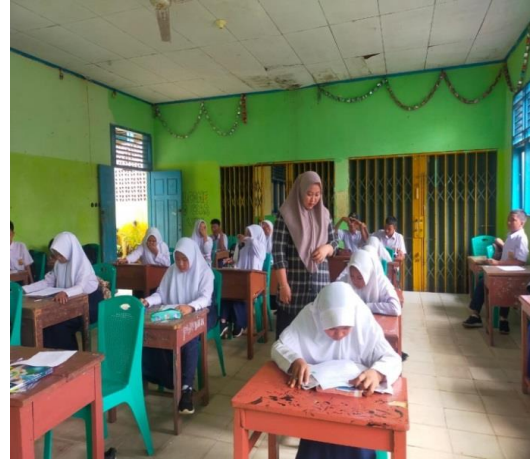
Pembagian Angket di Kelas VIII.1