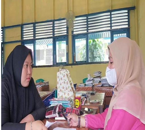
Wawancara dengan Guru PAI-BP