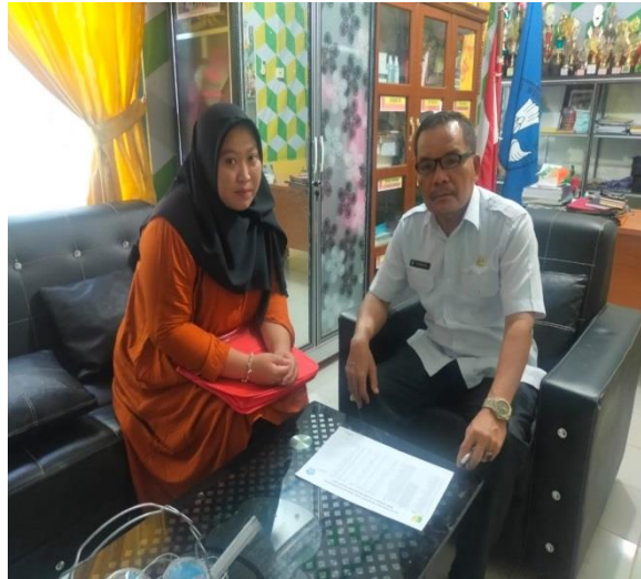
Wawancara bersama Kepala Sekolah