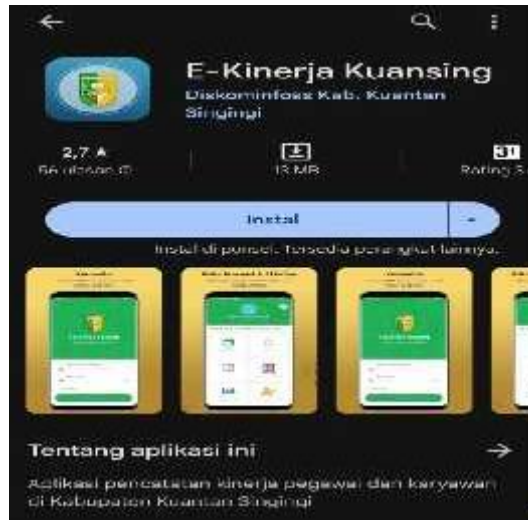
Gambar.1.1 Bentuk Aplikasi E-Kinerja

Prestasi Kerja Pegawai Negeri Sipil, Peraturan Bupati (PERBUP) tentang Perubahan atas peraturan Bupati Kuantan Singingi Nomor 33 Tahun 2020 tentang Tata Kelola Sistem Pemerintahan Berbasis Elektronik.