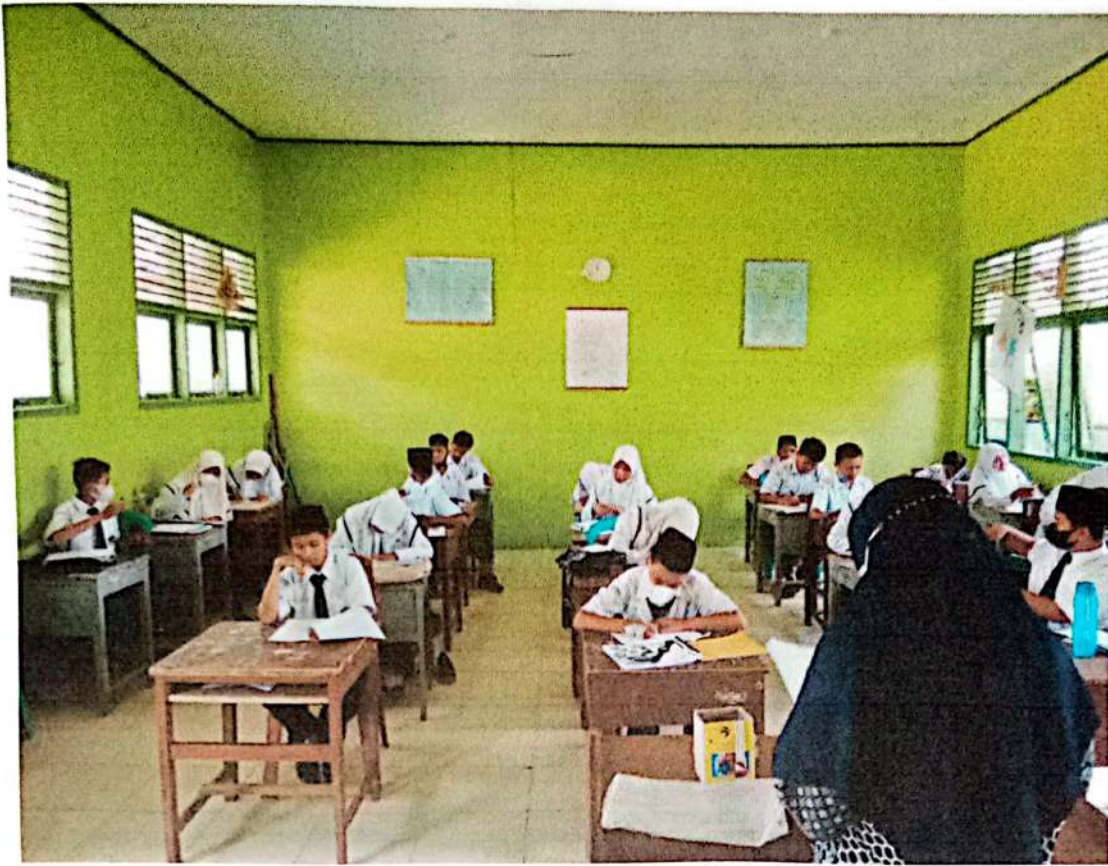
Gambar 5 : Responden Mengisi Angket Penelitian