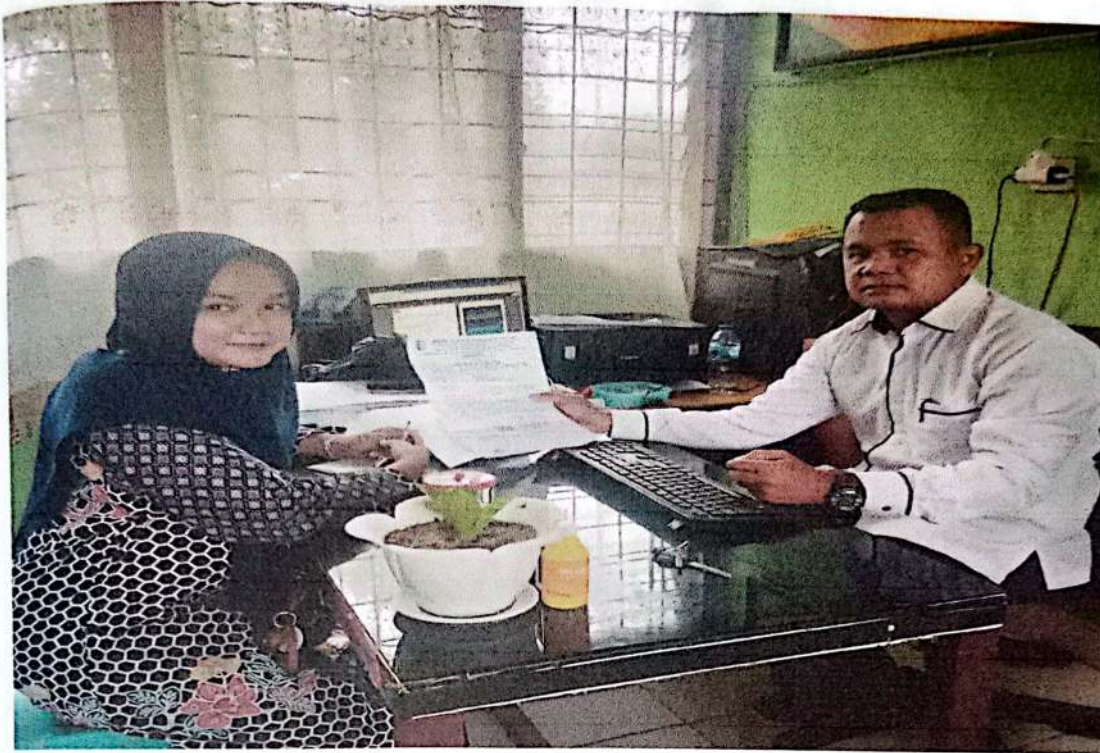
Gambar 3 : Bersama Bapak Kepala TU