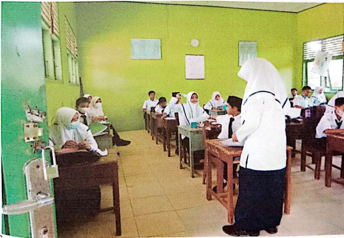
Gambar 4 : salah satu siswa membagikan Angket penelitian kepada Teman temannya